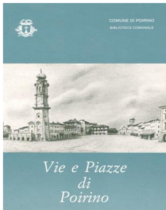
Vie e piazze di Poirino (1985)